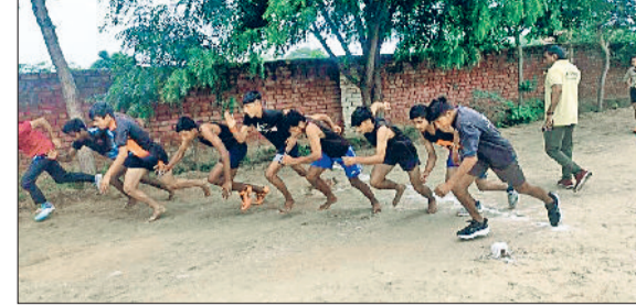
भिवानी। खेलकूद प्रतियोगिता में बेहतरीन प्रदर्शन करने वाले प्रतिभागियों के साथ शिक्षक व दौड़ स्पर्धा में भाग लेते प्रतिभागी।