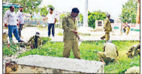
बवानीखेड़ा। बवानी खेड़ा स्थित शहीद गुलाब सिंह पार्क में खड़ी कांग्रेस घास व अन्य गंदगी को साफ करते हुए नया सफाई कर्मचारी।

तोशाम। गांव सण्डवा में किसान पानी आने का लंबे समय से इंतजार कर रहे हैं सिवानी लिंक से सण्डवा रजबाहे में फरवरी महीने से पानी नहीं आ रहा है जिससे किसान सिंचाई के पानी का इंतजार कर रहे हैं। 300 से ज्यादा किसान इस सण्डवा रजबाहे के पानी से खेती पर निर्भर रहते हैं। हल्के तोशाम के कुछ गांव सांगवन, दांग, बीरन आदि गांव पानी से डूब रहे हैं तो वहीं गांव सण्डवा के किसान सिंचाई के पानी आने का इंतजार कर रहे हैं। किसानों ने बताया कि फरवरी के बाद से इस सण्डवा रजबाहे में सिंचाई के लिए पानी नहीं आया है।