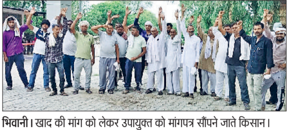
भिवानी। खाद की मांग को लेकर उपायुक्त को मांगपत्र सौंपने जाते किसान।

जा सके। किसानों ने बताया कि पिछले दो सप्ताह से खाद के लिए लगातार अनाजमंडी स्थित सरकारी खाद की दुकान पर पहुंच रहे हैं, लेकिन उनको खाद नहीं मिल पा रही है। सुबह उनको अगले दिन की कह कर वापस भेज दिया जाता है, लेकिन शाम पांच बजे के बाद खाद के स्टॉक को दाएं बाएं किया जा रहा है। किसानों ने निजी दुकानदारों को भी खाद देने का आग्रह लगाया। अगर वे निजी दुकानदारों के पास खाद के लिए जाते हैं तो उनको यूरिया व डीएपी