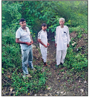
तोशाम। माइनर में पानी न पहुंचने के बाद झाड़िया दिखाते किसान।