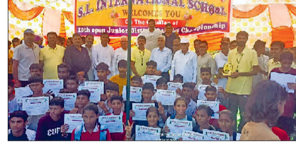
भिवानी। खेलकूद प्रतियोगिता में बेहतरीन प्रदर्शन करने वाले प्रतिभागियों के साथ शिक्षक व दौड़ स्पर्धा में भाग लेते प्रतिभागी।