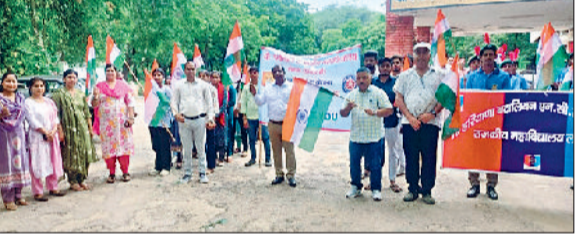
लोहार। तिरंगा यात्रा में हिस्सा लेते चौधरी बंसीलाल कॉलेज के शिक्षक व विद्यार्थी।

लोहार के विभिन्न शिक्षण संस्थानों में तिरंगा यात्रा निकाल दिया देशभक्ति का संदेश