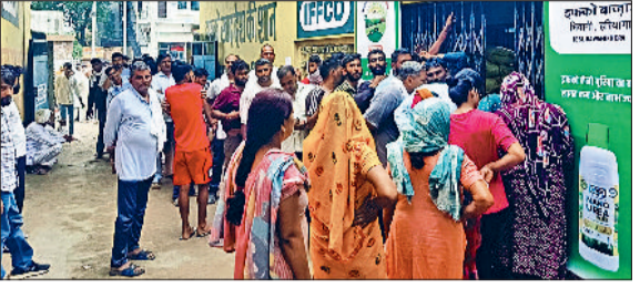
भिवानी। खाद के लिए लाइनों में लगे किसान।

चाहे रबी फसल की बिजाई की बात हो या फिर खरीफ की, किसानों को दोनों सीजनों में खाद की समस्या से जुझना पड़ रहा है