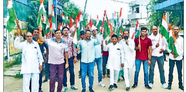
चरखी दादरी। तिरंगा यात्रा निकालते विद्यार्थी।

भय तिरंगा यात्रा से देशभक्ति से ओत प्रोत नजर आया पूरा क्षेत्र